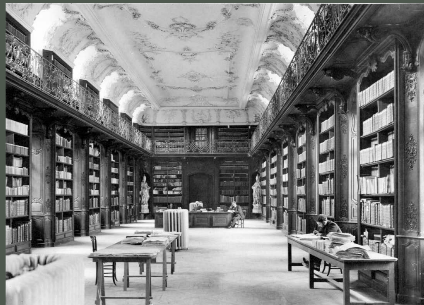
Bibliothèque avant destruction

L'ensemble de ces collections est installé dans une salle spécialement aménagée à cet effet, au premier étage du bâtiment en haut de l'escalier ovale et constitue la nouvelle bibliothèque, baptisée "Bibliothèque André Grandpierre".