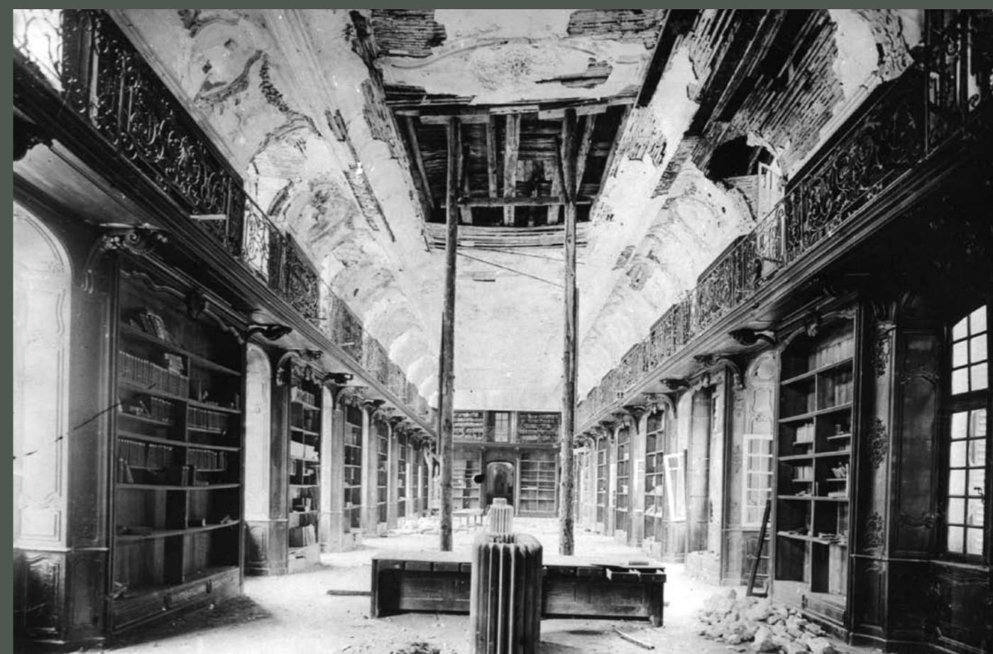
Bibliothèque après 1944